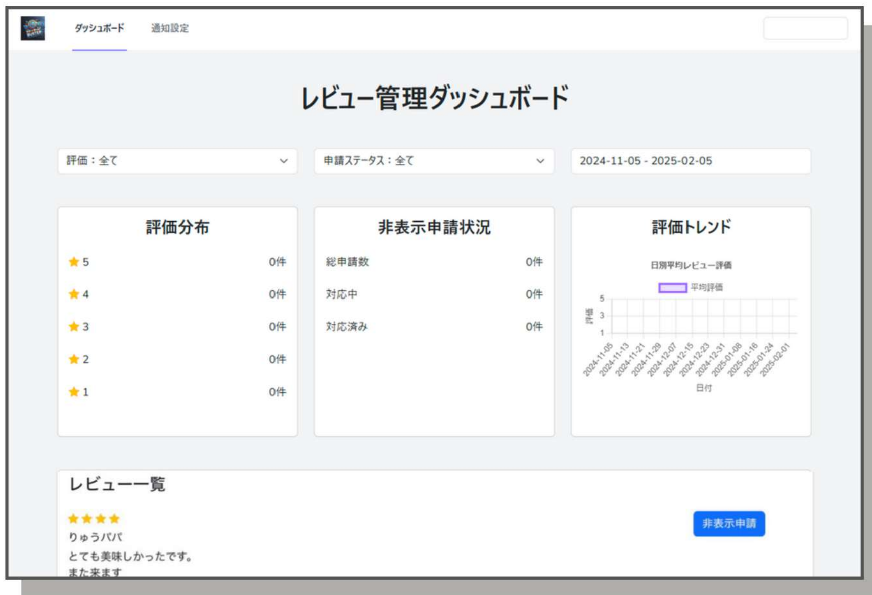
ログイン時の管理画面