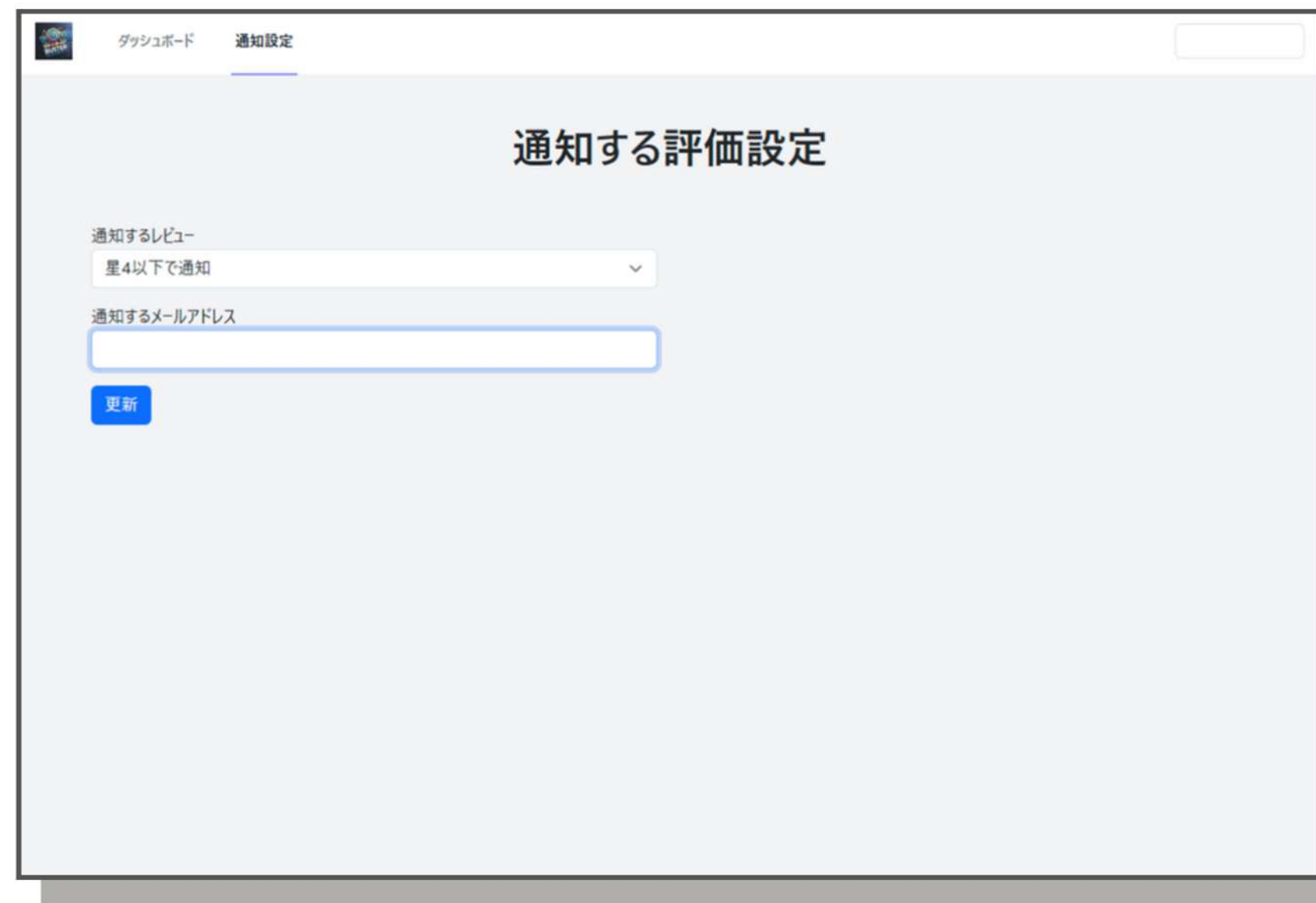
通知したい評価の設定画面